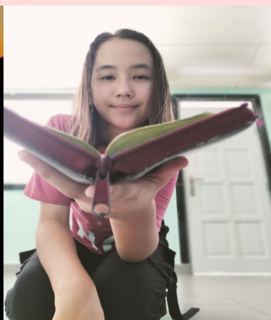
Bijbel vers voor deze nieuwsbrief