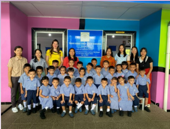
Kleuterklas A + B