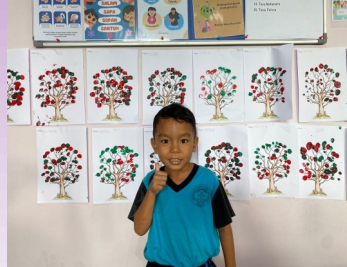
Jeskel die in TK B zit