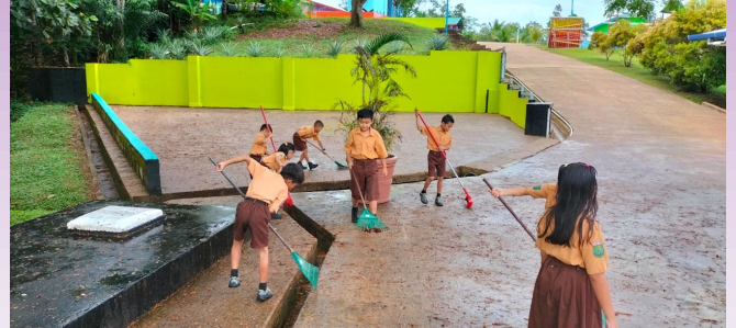
Klas 3 ( God schiep de wereld, onze taak is om het schoon te houden)