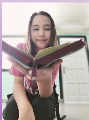
Bijbel vers voor deze nieuwsbrief