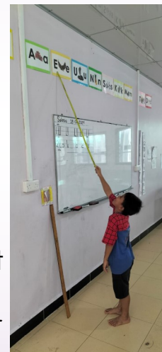
Oki, die de letters aanwijst

Wat ben ik toch blij met mijn klasje, zij geven mij elke dag nieuwe blijdschap, zo vrolijk hoe ze elke dag naar mijn klasje komen. Bid mee voor mijn leesklasje.