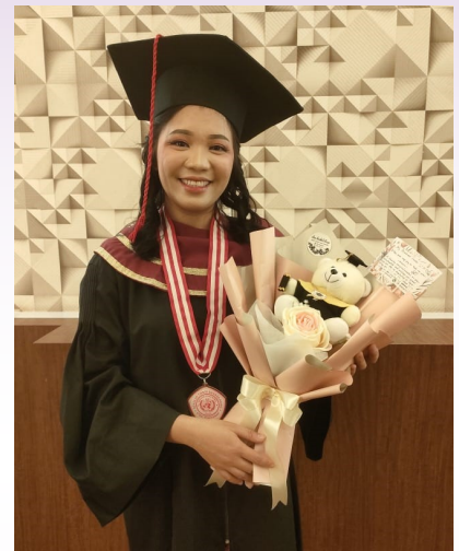
Nofi die afgestudeerd is