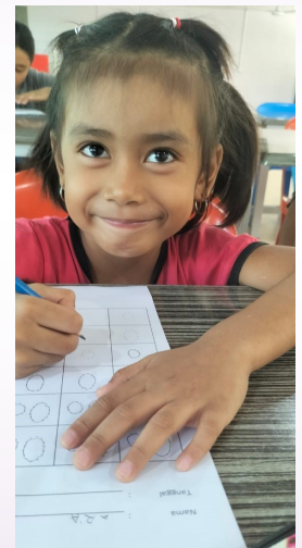
Are, she always smiles